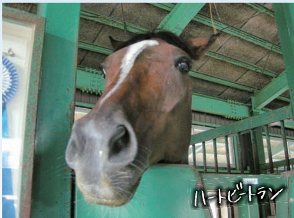
ハートビートルン