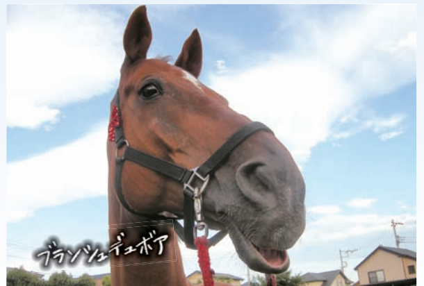
ブランシュデュポア