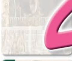
自 分の存在価値を 高める