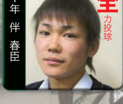
N ever give up!