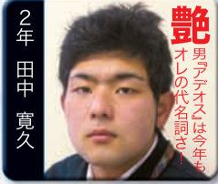
艶 男アナタは今年も オレの代名詞!