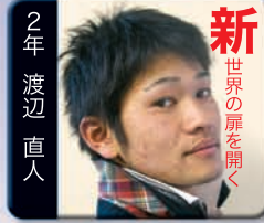
新 世界の扉を開く