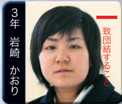
一 致団結すること