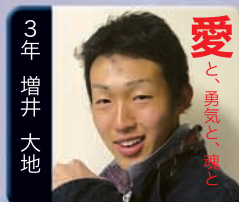
愛 と 勇気と 魂と