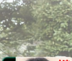
継 続は力なり!! どてか魂??