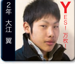
Y ES! 万枚!