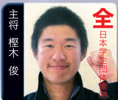
全 日本学生団体優勝 日本学生団体優勝 個人共に勝つ!!!