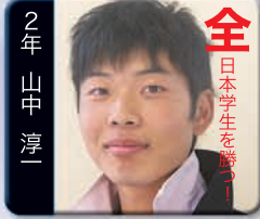
全 日本学生を勝つ!