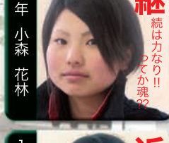
雷 電で大会に 出場する