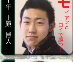
モ イヤと ロイで勝つ!