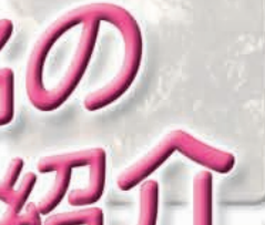
自 分の存在価値を 高める