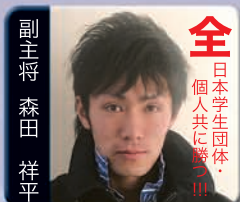
全 日本学生団体 個人共に勝つ!!!