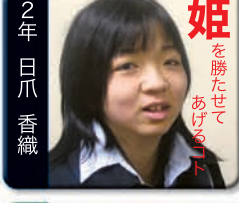
姫 を勝たせて あげるコト