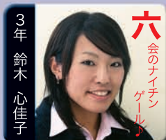
六 会のナイチン ゲール